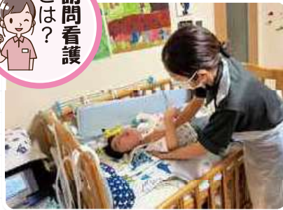
ご本人の了解を得て掲載しています。