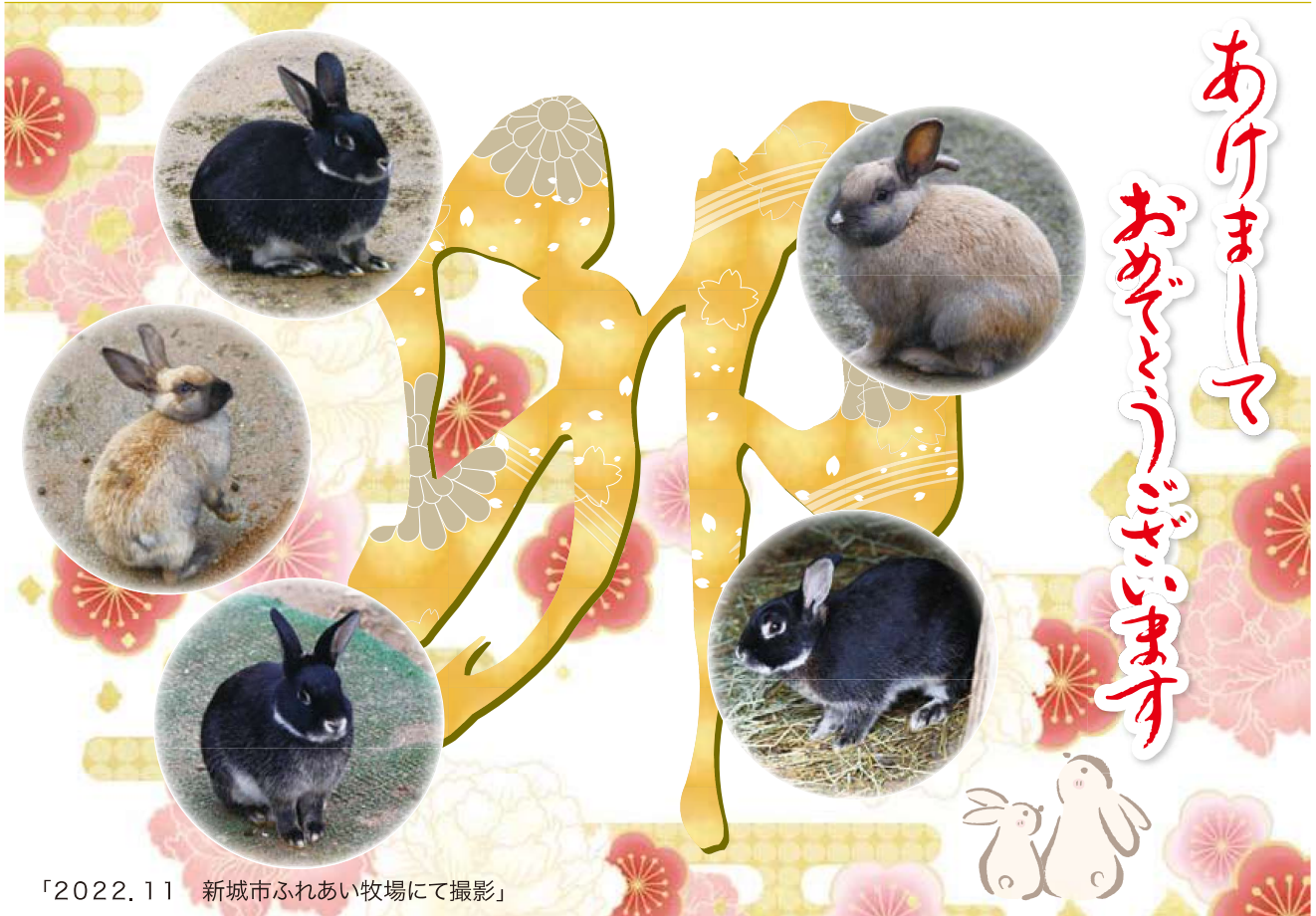
「2022.11 新城市ふれあい牧場にて撮影」