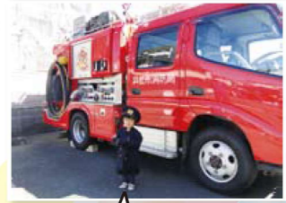
消防自動車 came だよ! 消防服にヘルメット カッコいいかな?!