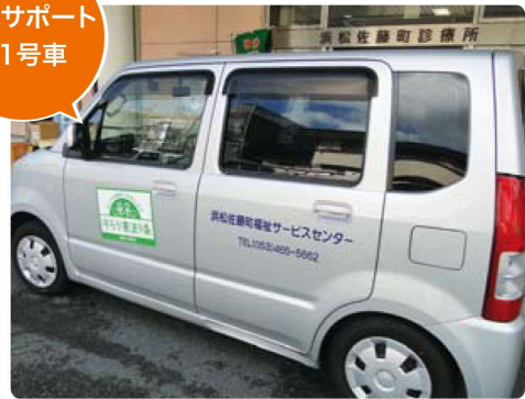
通院サポート 11号車