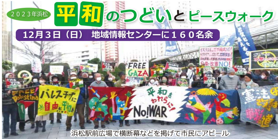
浜松駅前広場で横断幕などを掲げて市民にアピール

2人の弁護士さんが扮した「阿佐ヶ谷姉妹」ならぬ「四谷姉妹」、笑いの中にピリリと決まった憲法談義に会場は大盛り上がりです。「憲法は私たちの権利を守ってくれる。平和・人権・ジェンダー平等も」と、分かりやすいお話でした。講演後、会場から浜松駅前まで「イスラエルに平和を」とピースウォークをして、浜松市民に平和を訴えました。