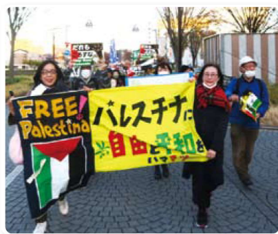
ピースウォークの先頭を歩く「四谷姉妹」

2人の弁護士さんが扮した「阿佐ヶ谷姉妹」ならぬ「四谷姉妹」、笑いの中にピリリと決まった憲法談義に会場は大盛り上がりです。「憲法は私たちの権利を守ってくれる。平和・人権・ジェンダー平等も」と、分かりやすいお話でした。講演後、会場から浜松駅前まで「イスラエルに平和を」とピースウォークをして、浜松市民に平和を訴えました。