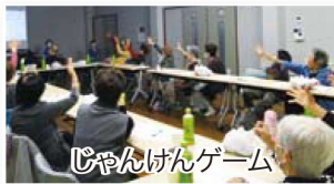
じゃんけんゲーム

「1・2・3・・・」と数えながら足踏み、さらに手をたたき時々手を挙げます。そのタイミングがうまくかわずに「アレッ!」、皆さん楽しそうに笑いながらゲームをしているように体を動かすことが出来ました。