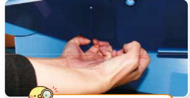
きれいになったかな?