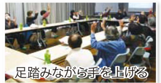
足踏みながら手を上げる